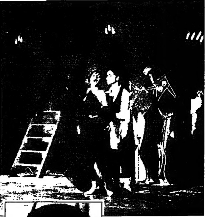
مشهد من مسرحية «الحر الرياحي»... (والى اليسار) مشهد من مسرحية «الخاتم» وهي اخراج مشترك له مع زياد جلال

والجبهة انتشة ملحوظة منذ تاسيسها ان قامت الهجوم على شيخ الازهر للشيوخ الاحمدى الغزالي سنة 1947 بسبب مشروعته لتطوير الازهر وفي عام 1955 قامت حملة على الشيخ عبد الحميد بخيت احد علماء الازهر لانه اذنت باباحة افطار رمضان ان يجد مشقة في الصيام.